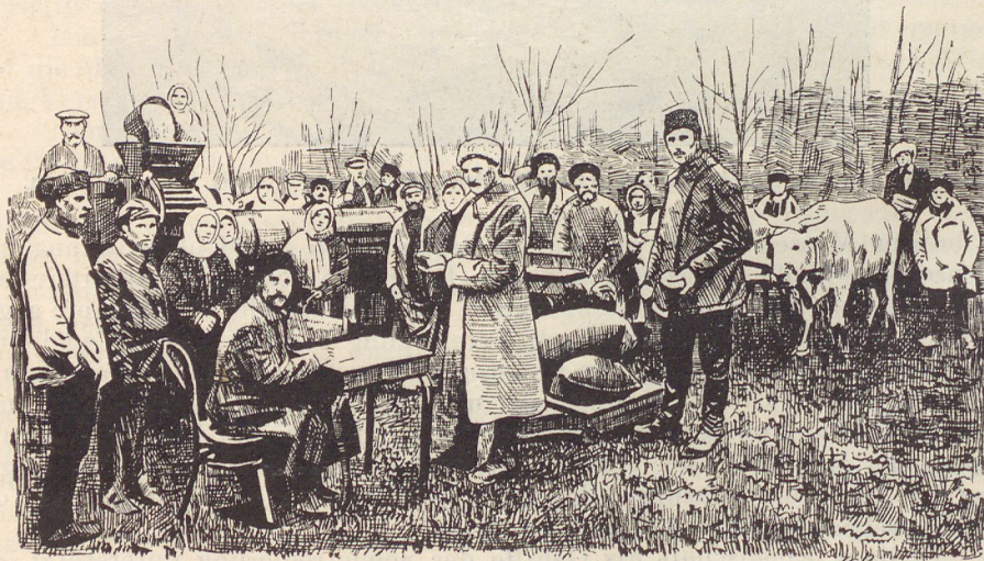
Platirowsche gegenseitige Bauernhilfe des Kubanschen Bezirks. Die Herausgabe des Samenvorschusses.

nen (die Steuerkommissionen, Forstkommissionen, Darlehnskommissionen, Landverteilungskommissionen, Versicherungskommissionen usw.) unter die Dorfarmut.