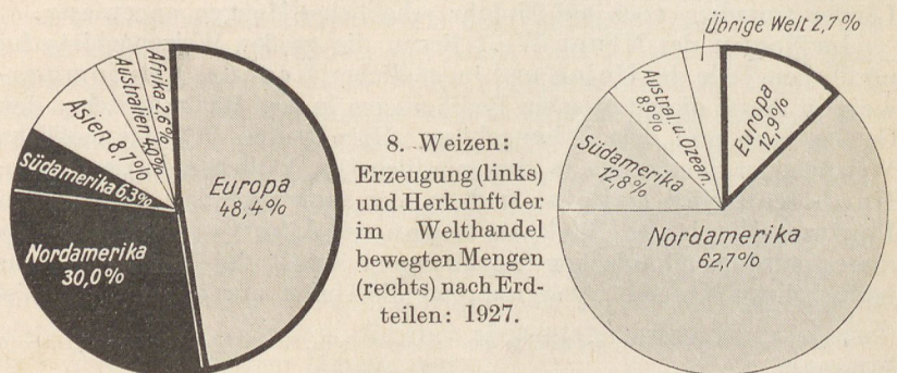
8. Weizen: Erzeugung (links) und Herkunft der im Welthandel bewegten Mengen (rechts) nach Erdteilen: 1927.

W = Westabschnitt der Weizenerzeugung; O = Ostabschnitt; E = Ernte; V = alte Vorräte; Sp = auf Speicher; Mv = Eigenverbrauch an Weizenmehl; Ma = Ausfuhr an Weizenmehl; S = Aussaat.