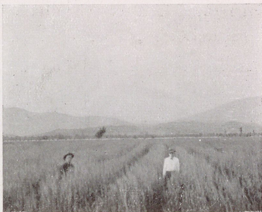
Un campo di grano presso Sciac. Terre coltivate dall'Ente Industriale Agrario Albanese (Eiaa).

riforme legislative possono giovare. Non viene però disconosciuta la necessità di integrare le riforme del regime agrario, con azione diretta-