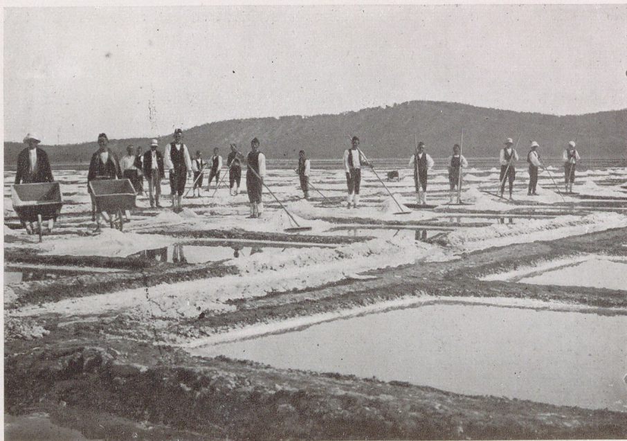
Le saline Valona.