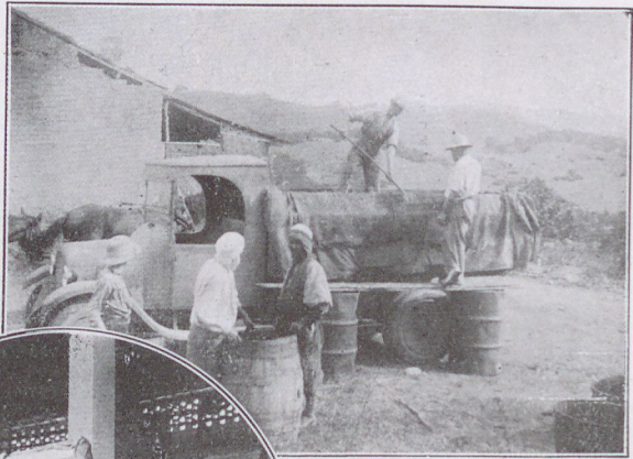
Une scène de Vendanges dans la MITIDJA (Marengo)