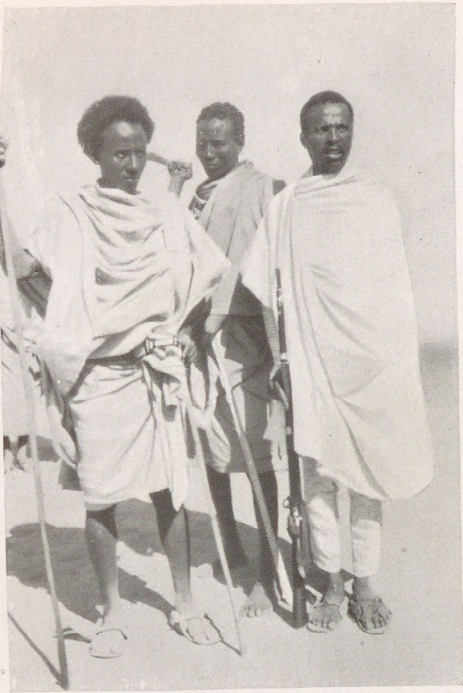
Arussi-Krieger beim Besuch der Baumwollplantage Neizels